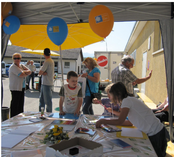
Concours de dessin ou de peinture sur le thème du solaire Le soleil, source d'inspiration : qui créera la plus belle œuvre d'art ?