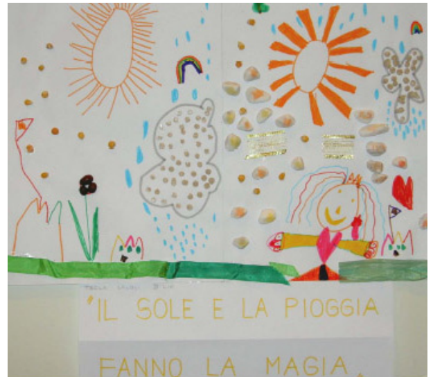
Exposition sur les énergies renouvelables Les élèves de maternelle et écoliers/écolières présentent leurs travaux. Une exposition permet d'aborder le sujet de manière créative.