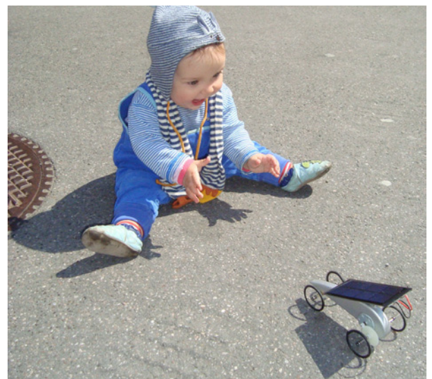
Course de véhicules solaires Incitez vos élèves à construire et à essayer leurs propres voitures miniatures ou d'autres machines fonctionnant au solaire.