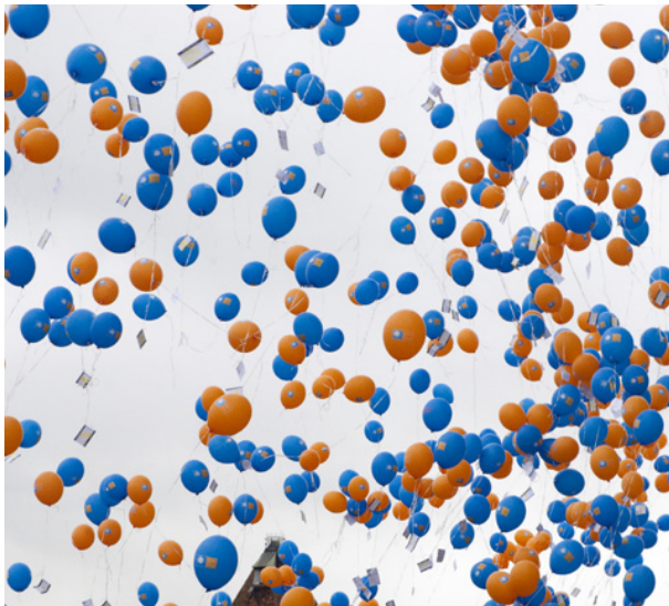
Lâcher de ballons aux couleurs des Journées du Soleil Organisez un grand concours de lâcher de ballons avec des prix attractifs. Y compris des cartes de vœux pour le climat avec champ d'adresse.

La Société Suisse pour l'Énergie Solaire SSES est responsable de la coordination des Journées du Soleil qui se dérouleront dans toute la Suisse au mois de mai et met à disposition un site Internet contenant des informations détaillées. Inscrivez votre événement dans le calendrier des manifestations sur le site www.journeesdusoleil.ch et commandez-y le matériel publicitaire souhaité (ballons, banderoles, brochures, t-shirts, sacs de toile, etc.). En mai, vous pourrez susciter l'enthousiasme de vos élèves pour l'énergie du soleil, moyennant diverses activités solaires. Laissez-vous inspirer par les exemples ci-dessous et contribuez ainsi à un avenir d'énergies renouvelables pour nos enfants.